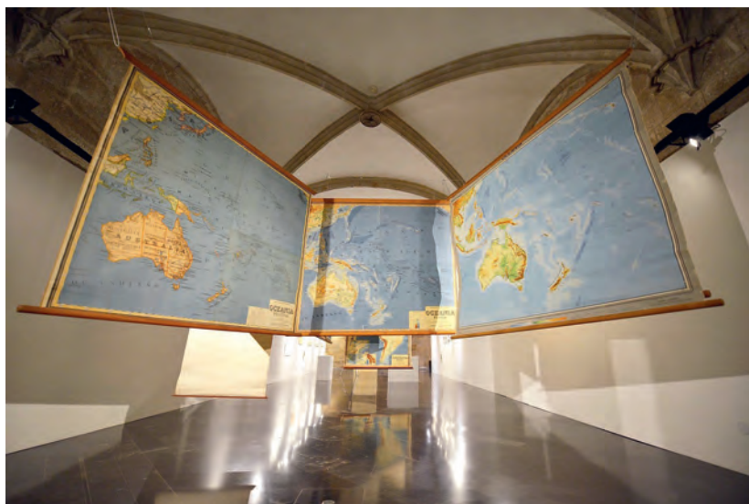
Imatge 5: Instal·lació dels mapes d'Oceania com a espai de possibilitat

Després de l'experiència amb aquestes instal·lacions volem acabar amb les preguntes següents: seguirem continuarem veient els mapes i el material cartogràfic del fons de l'arxiu del Museu Pedagògic de Castelló com un material didàctic utilitzat en un moment determinat de la història de l'educació? O més aviat com un material que encara pot generar noves possibilitats d'aprenentatge?