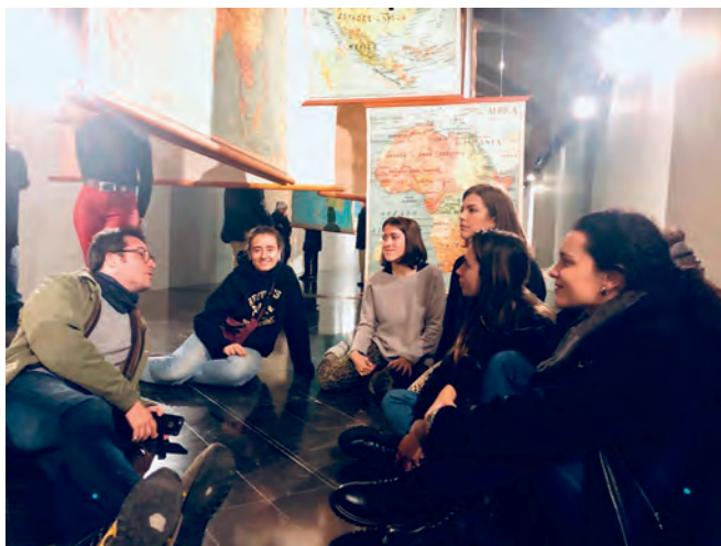
Imatge 4: Instal·lació en el marc de l'exposició «Apunts sobre la impossibilitat de la imatge del món»

A l'exposició realitzada a Lleida, hem invitat a tres artistes contemporanis, Walmor Correa, Roc Domingo i Maite Vilafranca, perquè ens ajudin amb la seva mirada a explorar el que pot esdevenir del diàleg i la interacció amb el material que forma part del patrimoni històric, en aquest cas un material concret, els mapes. Les seves creacions han traçat noves cartografies i noves propostes que han permès que escoles que han partit d'aquesta exposició desenvolupessin els seus projectes de treball. 54