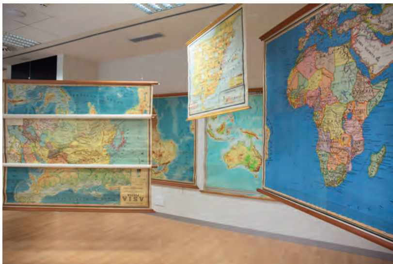
Imatge 3: Laberint de mapes a l'espai Menador

La intervenció «Les regles cartogràfiques» conjuga els dos principis sobre els que quals s'assenta el pensament cartogràfic post-representacional. 29 Per una banda exerceix una part de la feina deconstructiva que intenta desemascarar aquelles veritats ocultes entre les línies del text cartogràfic; així, l'audiència, segons el punt de vista que esculli, pot veure-hi relacions de dominació econòmica, cultural o política d'uns països sobre altres, entre d'altres. 30 D'altra banda, veu els mapes com pràctiques, experiències, actuacions i espais. 31 La instal·lació, com ja hem dit, no es pot aprehendre des d'un punt fix només amb la mirada, per la qual cosa, el públic necessita recórrer-la, experimentar-la i sentir-la amb tots el cos, ja que la naturalesa fragmentària de les instal·lacions necessita que els cossos de l'audiència siguin tractats com a presències en l'es-