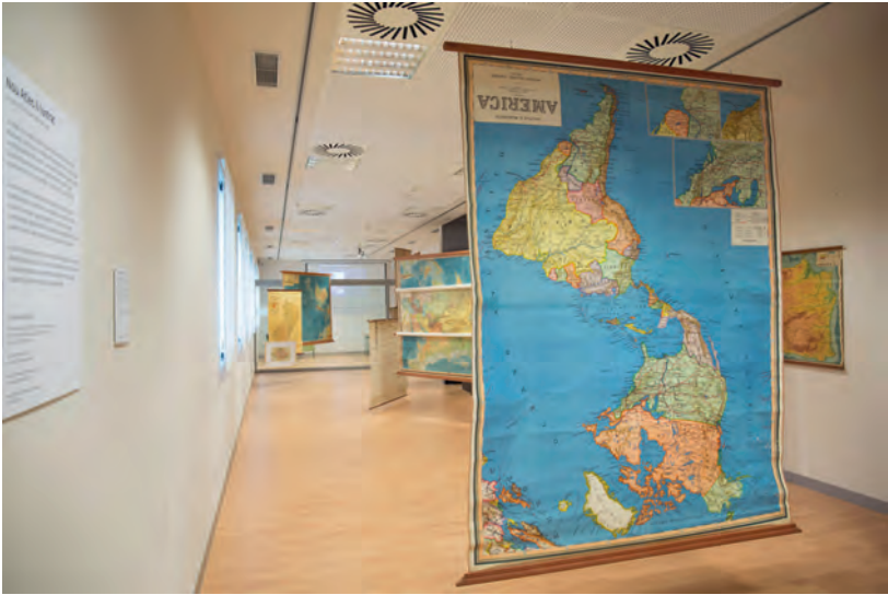
Imatge 2: Mapa d'Amèrica surejat

Com que la instal·lació no es pot aprehendre d'un sol cop d'ull cal que l'audiència es passegi per la sala a fi de veure'n els detalls. En aquest moviment per la sala l'usuari de la instal·lació va veient les diverses superposicions que fan els mapes entre ells, creant diverses narracions que es fan i es desfan a mesura que s'hi desplacen. La intervenció pretén reflexionar sobre el que representa un mapa i la forma en què es mostren inviten a crear noves cartografies i establir nous diàlegs que ens ajuden a construir narratives que sovint han quedat invisibilitzades, atès que es convidava l'audiència a recórrer la instal·lació i fotografiar-la creant nous conjunts territorials a partir de les diverses superposicions de mapes que es podia trobar en ellatrobant-hi i compartir les fotos a Twitter i a Instagram amb el hashtag #apuntsregles.